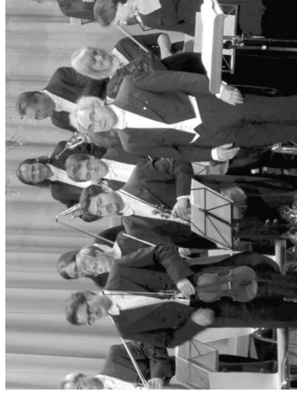
Bravo, eine sehr gelungene Aufführung ist zu Ende