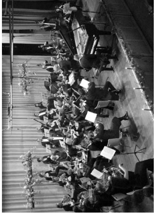
Das erweiterte Südwestdeutsche Kammerorchester Pforzheim