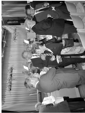
In der Pause