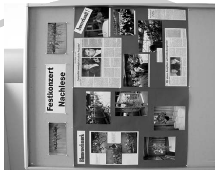
Es war eine sehr gelungene Jubiläumsfeier