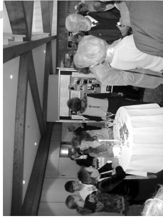
In der Pause im Foyer