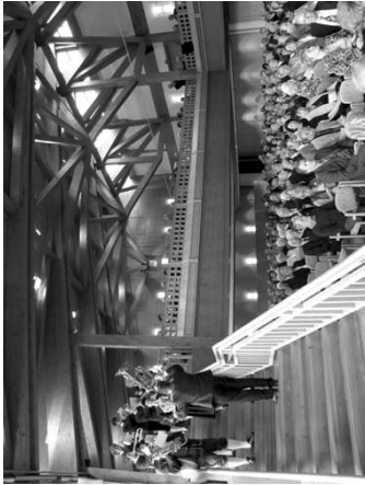
Fischinger 1150.-Jubiläums-Fanfare eröffnet das Festkonzert