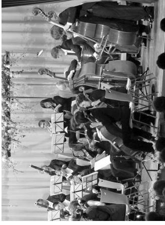
Die voll konzentrierten Musiker