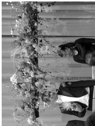
Unter dem Blumenschmuck . . .