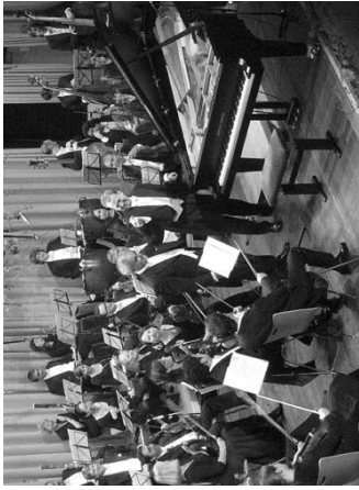
Nach dem 3. Klavierkonzert von Ludwig van Beethoven