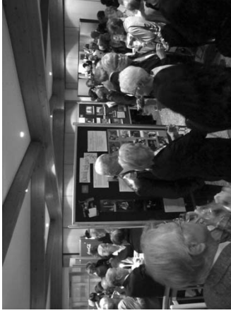
Die Ausstellung im Foyer